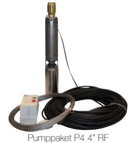
Pumppaket P4 4" RF

För olika brunnsdjup mellan 30 och 130 m. Pumppaketen innehåller pump med motor enl. Nema standard, färdigmonterad elkabel, rostfri wire 2.3 mm samt 2 st wirelös, kontaktormotorskydd (för 3-fas) och vattenfast eltejp. Anslutning 32.