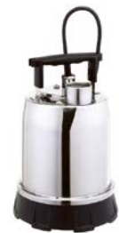
BEST ONE SUGKAPPA