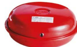
ERP 320, 416