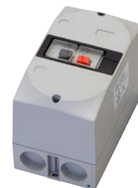
Kapslad motorskydds brytare