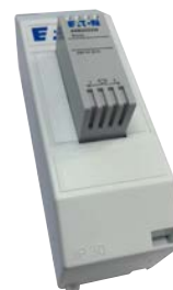
Summer ljudlarm kapslad